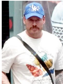
Fotografía tomada en 2024

Se le acusa de conspiración por distribución y posesión de cocaína con la intención de distribuirla; conspiración para exportar cocaína, conspiración para cometer un asesinato en conexión con una agrupación ilícita continua, delito relacionado con las drogas y asesinato en conexión con una agrupación ilícita continua, delito relacionado con las drogas; conspiración para manipular a un testigo, víctima o informante, y manipulación de un testigo, víctima o informante; conspiración para tomar represalias en contra de un testigo, víctima o informante y represalias en contra de un testigo, víctima o informante; conspiración para blanquear instrumentos financieros.