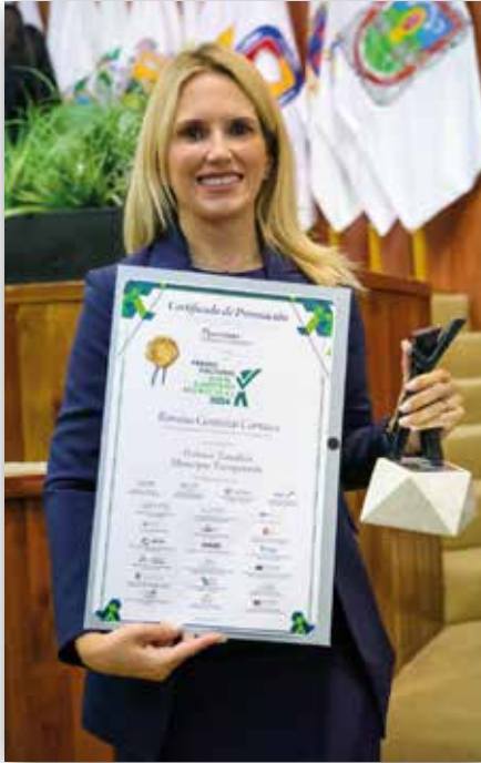
Premio Nacional al Buen Gobierno Municipal 2024 "Municipio Transparente"