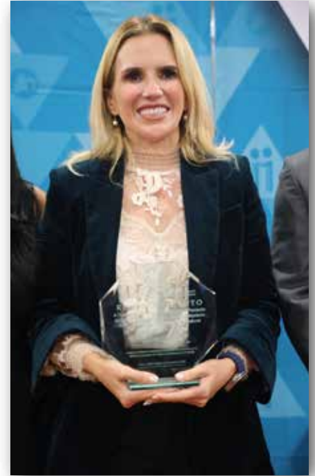
Reconocimiento a Práctica de Transparencia Proactiva 2024 del INFOEM